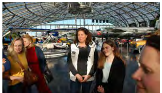
Firmenausflug zum 20. Jubiläum in den Hanger 7