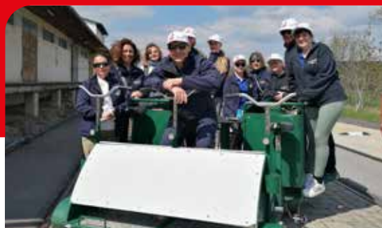
Draisinentour im Burgenland